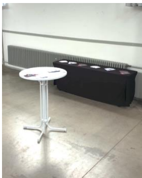
Bild 1 bereitgestellter Standard Messestand